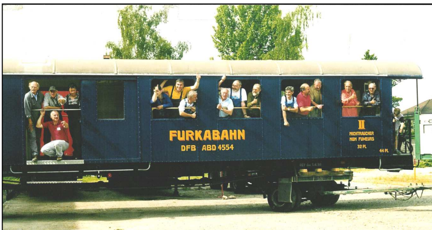
Mit Stolz im ersten Aargauer Wagen vor dem Transport nach Realp

Innenwände mit schönem Birken-sperrholz. Die Polstergruppe für das 1.-Klasse-Abteil hat uns der damalige Wagenchef A. Brügger von einem umgebauten alten Bernina-Triebwagen beschafft. Sie konnte nach gründlicher Reinigung und kleineren Reparaturen eingebaut werden. Mit den gestickten Kopftüchern wirkt das Abteil äusserst nobel. Weitere viele Kleinteile wurden aufgearbeitet.