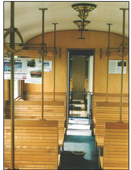
Die vollständig neue Inneneinrichtung