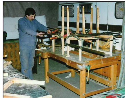
Holzbänke von Grund auf hergestellt

Wie schon erwähnt, besass der Wagen keine Inneneinrichtung mehr. Alles war neu herzustellen