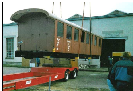
Der Wagenkasten schwebt in die Aarauer Werkstätte ein

In der damaligen Werkstätte Goldau wurde zuerst der hölzerne Wagenkasten abgehoben und das darunter liegende Chassis mitsamt seinen Drehgestellen in die Werkhalle